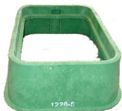
Rehausse (Hauteur 150 mm)