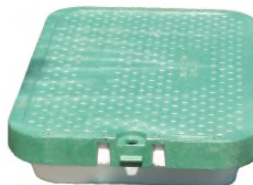
Couvercle Pehd Marquage Service des Eaux avec isolant.